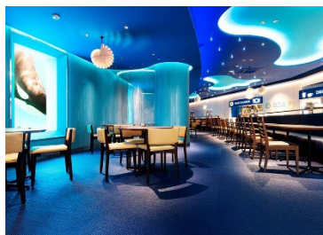
夕食会場のレストラン「OCEAN」