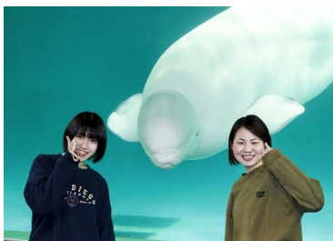
ペルーガと記念写真